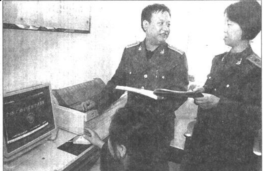
广饶县工商局九个基层工商所全部配备了微机，大大提高了工作效率。